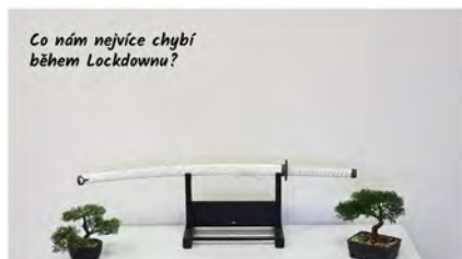
Co nám nejvíce chybí během Lockdownu?