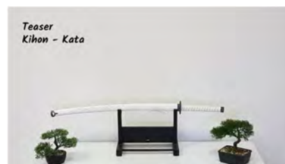
Teaser Kihon - Kata