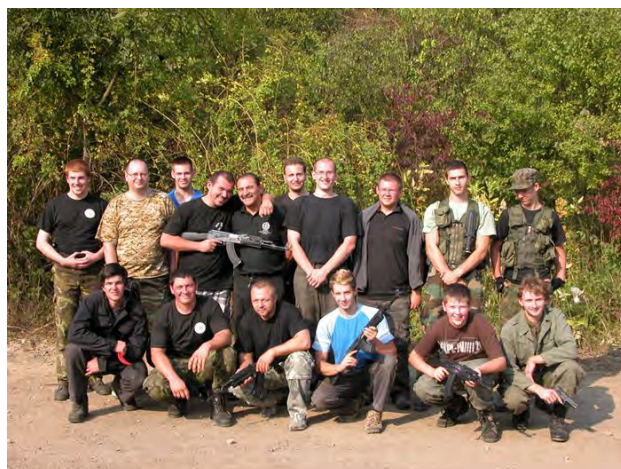
KAPAP Military Day Hustopeče 12.09.2009