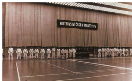
I. mistrovství ČSSR v Karate 1975

Od tohoto roku se koná každý rok Mistrovství ČSR jednotlivců – formou jednorázového turnaje. Mistrovství ČSR družstev – Národní liga karate je jako dlouhodobá soutěž. Kromě mistrovských turnajů, jsou pořádané soutěže k významným událostem. Tyto výsledky jsou postupně započítány do celoroční soutěže jednotlivců Velké ceny ČSR. Byla provedena změna názvu svazu na Svaz judo a karate. Byla přijata směrnice pro udělování výkonnostních tříd v karate a obecná část zkušebního řádu. Koncem roku počet karatistů stoupl na 1000 členů.