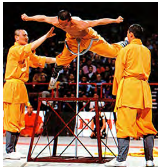
Autor: Antonín Grůza

Ve finále nakonec vyhrál zaslouženě výběr Japonského teamu, který byl připraven asi trochu lépe než ostatní. My se budeme těšit na další festival bojových umění v pařížské hale Bercy, a to již 14.ročník, ale na to si rok počkáme.