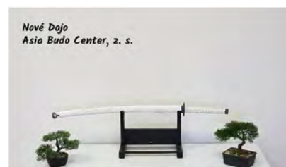
Nové Dojo Asia Budo Center, 2. s.

Nová pomůcka v našem Dojo - pytel Fighter