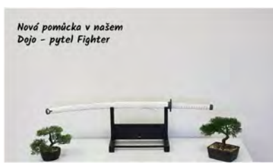
Nová pomůcka v našem Dojo - pytel Fighter