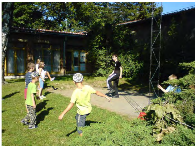
Bojový den pro děti v CVČ Lužánky Brno 07.08.2009