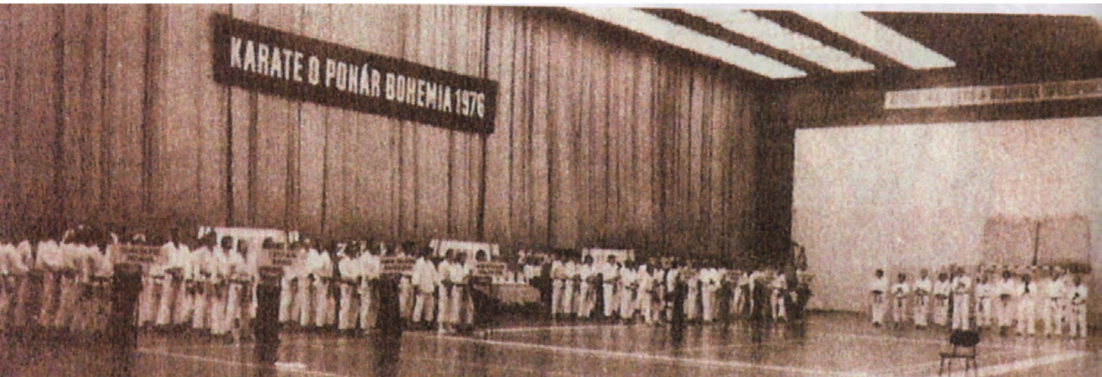
Pohár Bohemia, 13. 11. 1976 v Praze (sportovní hala Slavie IPS)