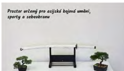
Prostor určený pro asijská bojová umění, sporty a sebeobranu