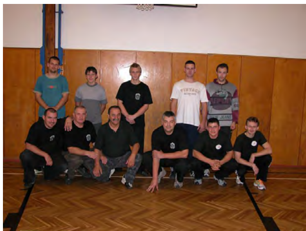
KAPAP Military Day č.2 Hustopeče 10.10.2009