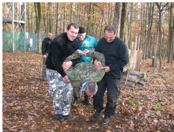
KAPAP Military Day č.3 Soběšice u Brna 14.11.2009