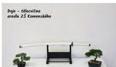
Dojo - tělocvična areálu ZŠ Komenského