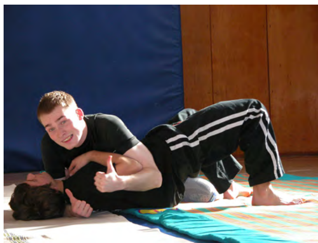
Seminář Brazílského Jiu Jitsu Hustopeče 08. 02. 2014