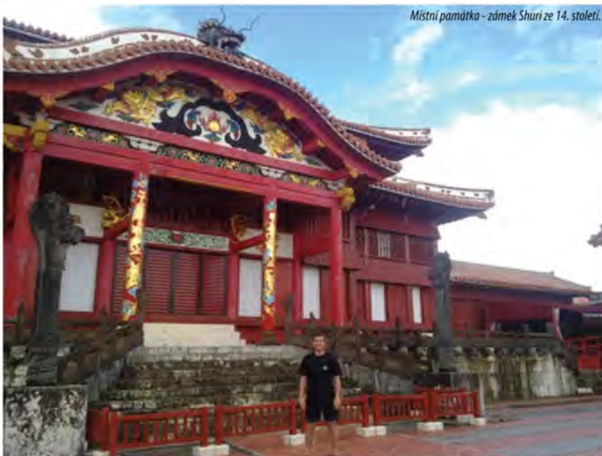
Místní památka - zámek Shuri ze 14. století.