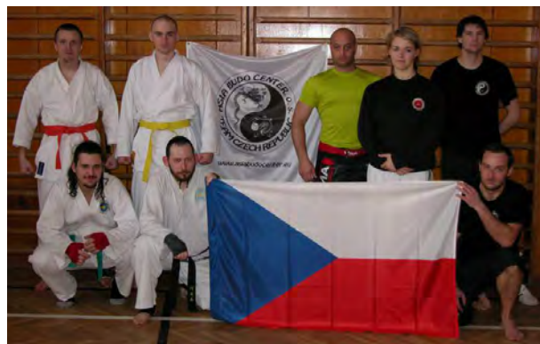
Trénink výběru ČR Hustopeče 11. 01. 2014