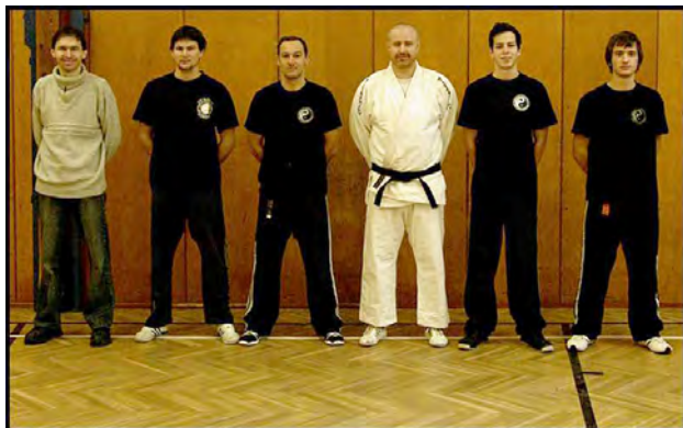
Seminář Ji Jitsu Hustopeče 14. 12. 2013