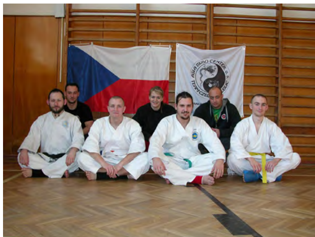
Trénink výběru ČR Hustopeče 25. 01. 2014