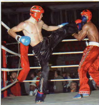
WACH Basel 2004.