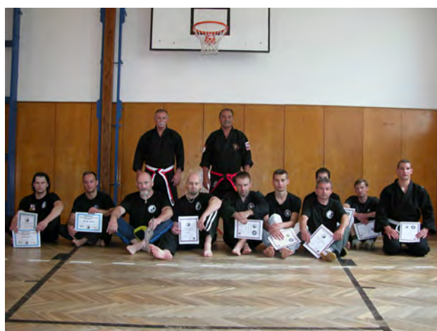
Zkoušky STV Sebeobrana Hustopeče 27. 06. 2015