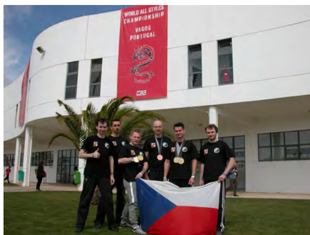
WAC 2015 Portugalsko 2015