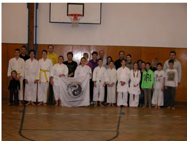
Trénink - Karate Hustopeče 23. 12. 2014