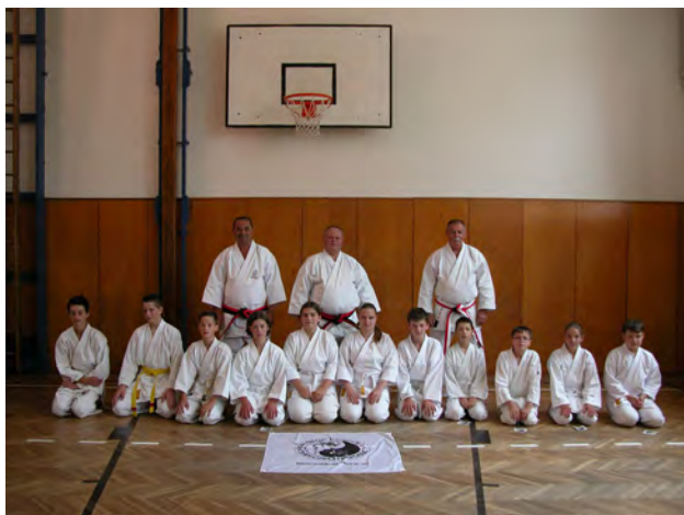
Zkoušky STV Karate Hustopeče 27. 06. 2015